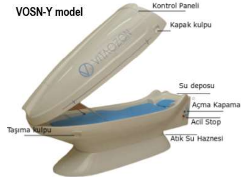
Resim 2 : Vitaozon Yataklı ozon sauna VOSN-Y model