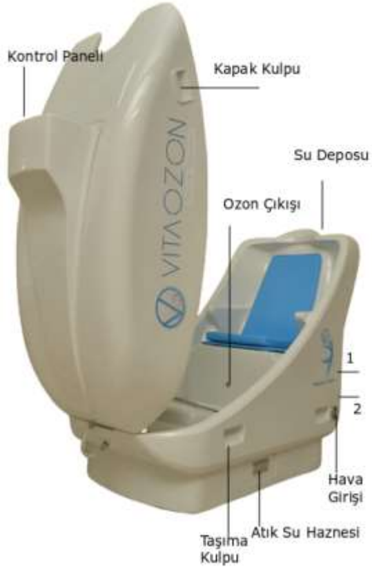
Resim 1: Vitaozon oturaklı ozon sauna VOSN-O model 1.Açma kapama 2.Acil stop